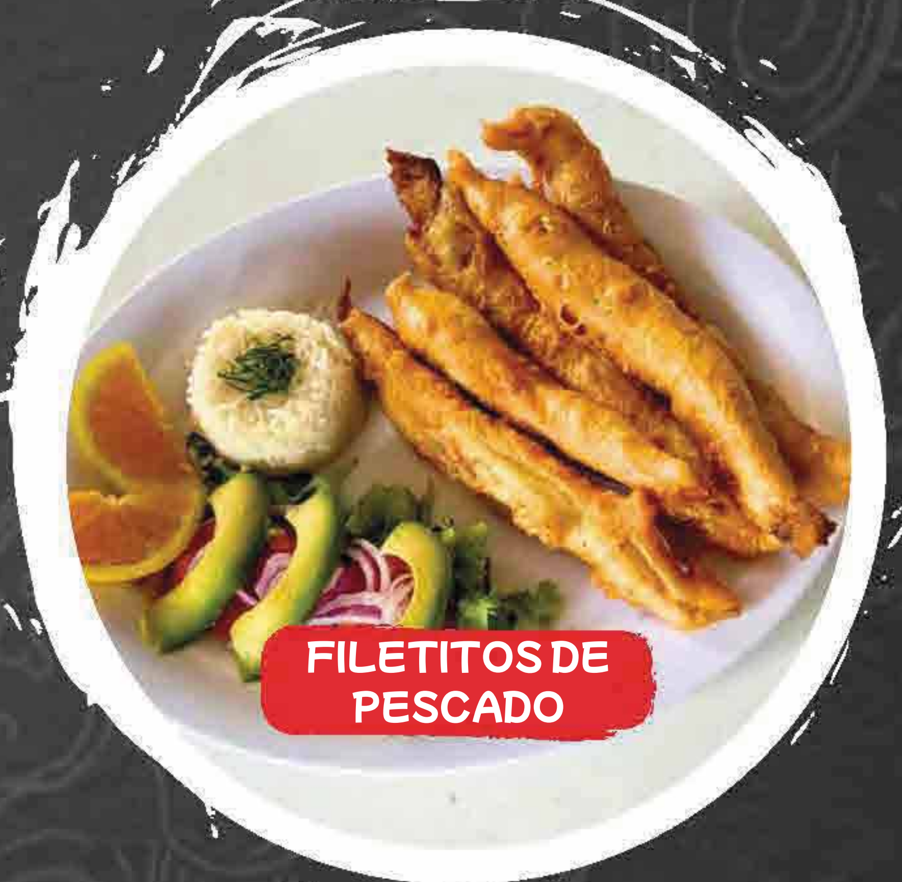
FILETITOS DE PESCADO