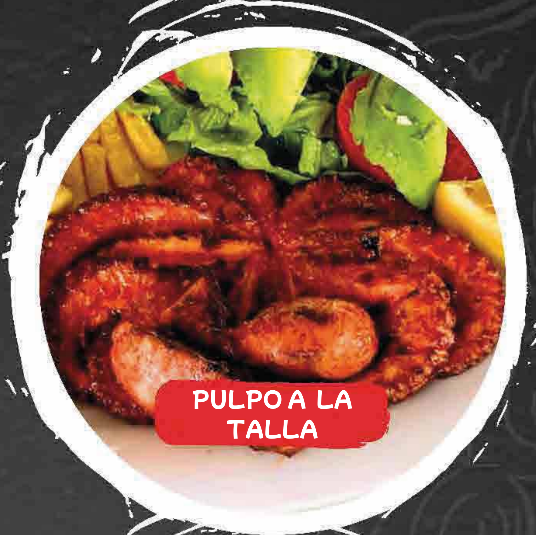
PULPO A LA TALLA